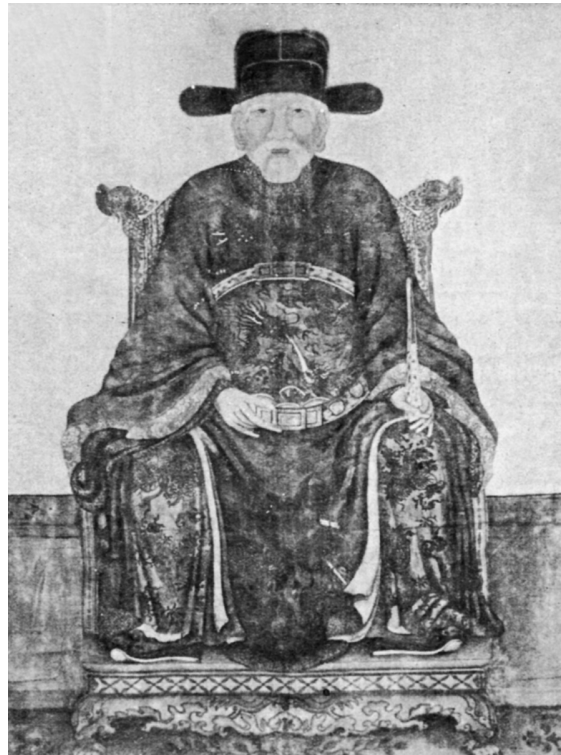
Nguyễn Trãi ( Tranh chân dung )