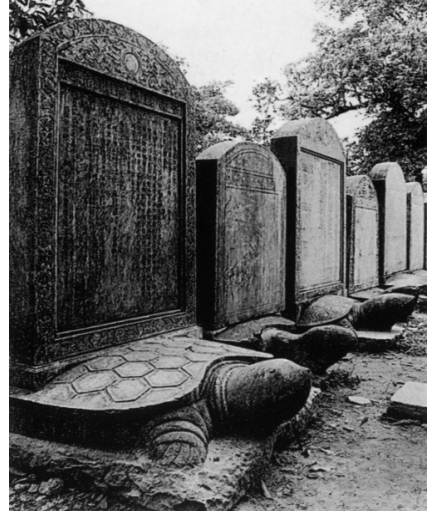
Bia Tiến sĩ, Văn Miếu, Hà Nội

Để phát triển giáo dục, khuyến khích nhân tài, từ năm 1439 trở đi, nhà nước phong kiến triều Lê đặt ra lệ xướng danh, yết bảng, ban mũ áo, cấp ngựa, đai yếm và vinh quy bái tổ cho những người đỗ đạt cao. Bài Đại Bảo tam niên Nhâm Tuất khoa tiến sĩ đề danh kí – Bài kí đề danh tiến sĩ khoa Nhâm Tuất, niên hiệu Đại Bảo thứ ba (1442) – do Thân Nhân Trung soạn năm 1484 thời Hồng Đức. Đây là một trong 82 bài văn bia ở Văn Miếu (Hà Nội).