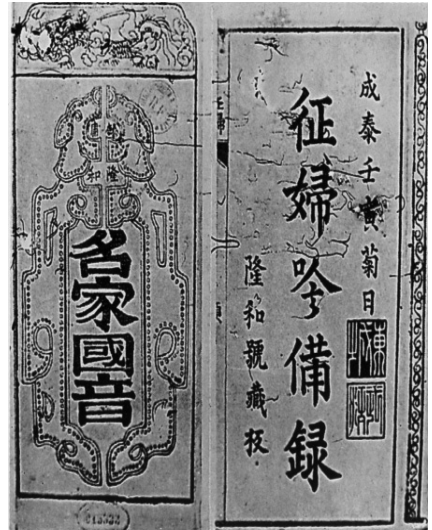
Ảnh bìa cuốn Chinh phụ ngâm bị lục

Sắt cầm (6) gượng gảy ngón đàn, Dây uyên (7) kinh đứt phím loan (8) ngại chùng.