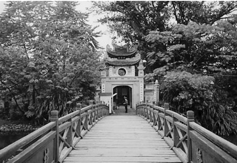
Đền Ngọc Sơn (Hà Nội)

Đến thăm đền Ngọc Sơn, hình tượng kiến trúc đầu tiên gây ấn tượng là Tháp Bút, Đài Nghiên – một biểu tượng của trí tuệ văn hoá. Tháp Bút dựng trên núi Ngọc Bội, đỉnh tháp có ngọn bút trở lên trời xanh cao vút, trên mình tháp là ba chữ son tả thanh thiên (viết lên trời xanh) đầy kiêu hãnh, hai bên lối đi có đắp