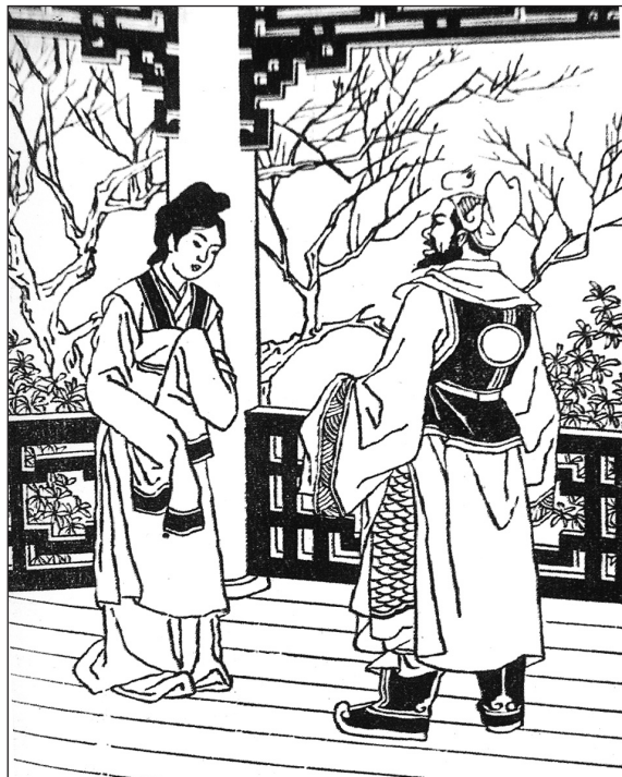
Thuý Kiều – Từ Hải

Cuộc đời Kiều tưởng như bế tắc hoàn toàn khi lần thứ hai rơi vào lầu xanh thì Từ Hải bỗng xuất hiện và đưa Kiều thoát khỏi cảnh ô nhục. Hai người sống hạnh phúc “Trai anh hùng gái thuyền quyên – Phỉ nguyên sánh phượng đẹp duyên cưới rồng”. Nhưng Từ Hải không bằng lòng với cuộc sống êm đềm bên cạnh nàng Kiều tài sắc, chàng muốn có sự nghiệp lớn nên sau nửa năm đã từ biệt Kiều ra đi. Đoạn trích (từ câu 2213 đến câu 2230) bao gồm ngôn ngữ tác giả và ngôn ngữ đối thoại cho thấy chí khí của Từ Hải.